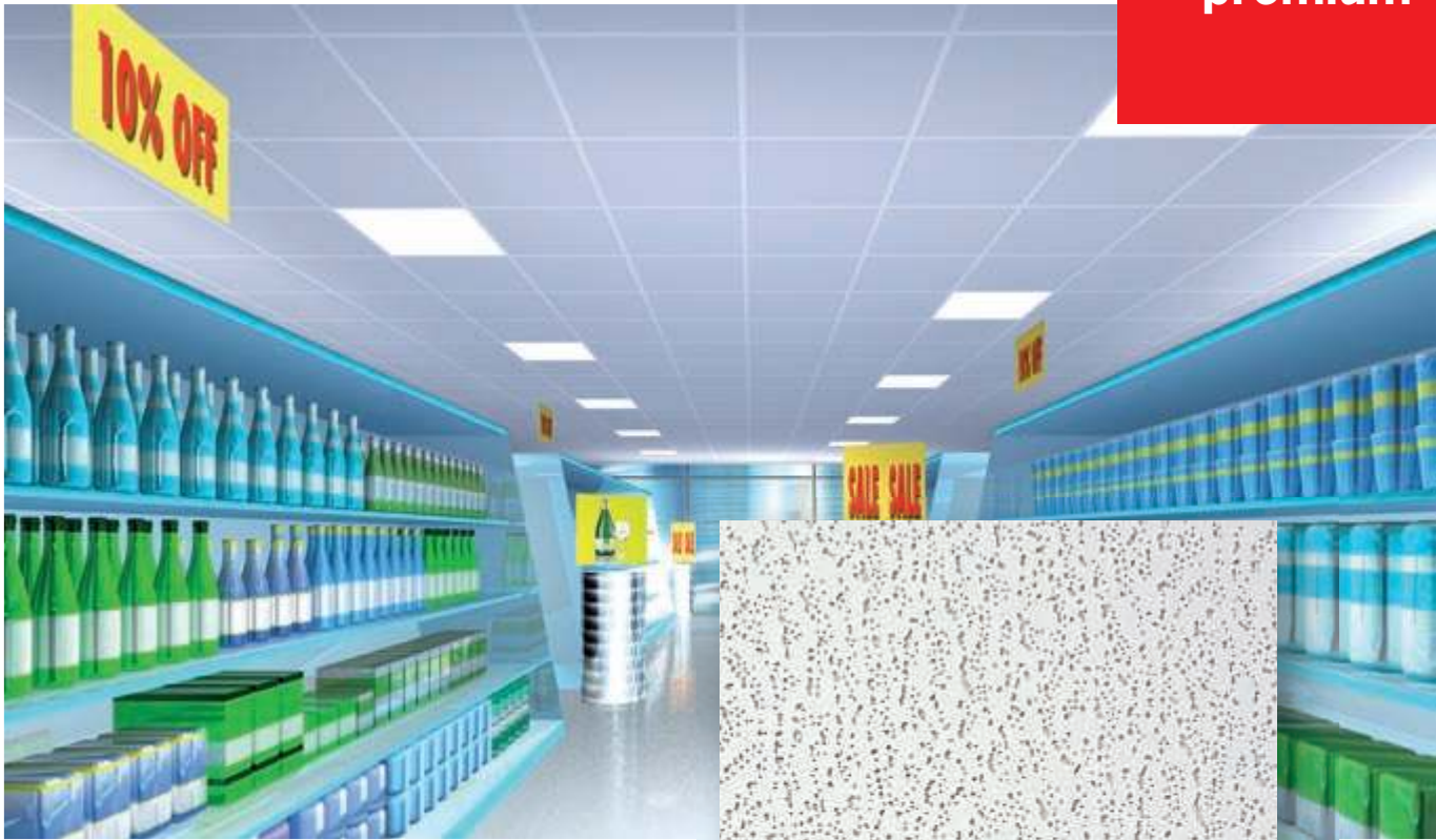
Oppervlakedessin Harmony Harmony 72