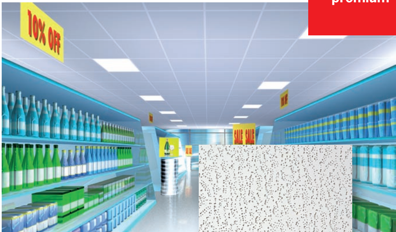
Oppervlakedessin Harmony Harmony 72